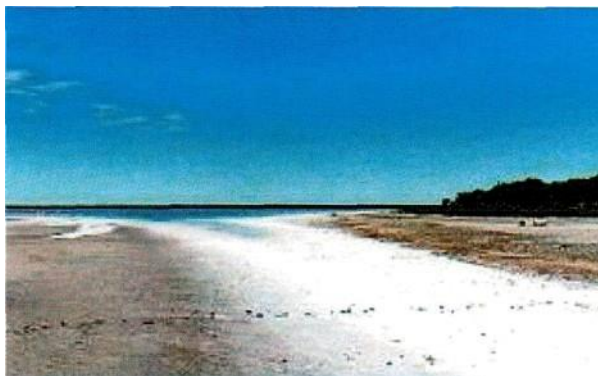
Una gruesa corteza de sal blanca reluce bajo el sol a lo largo de la ribera de La Sal del Rey.