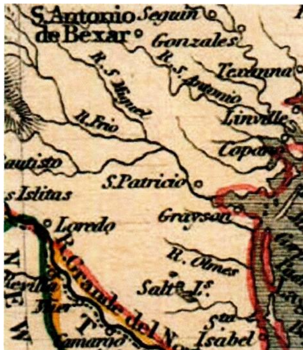
Mapa de alrededor de 1849, en el que se muestra La Sal del Rey. Designado como «Lagos de sal» («Salt Lakes» en inglés), lo ubica cerca del Puerto de Santa Isabel.

La extracción de sal continuó hasta la década de 1930. A pesar de los varios siglos de explotación, el lago aún contiene 4 millones de toneladas de sal dentro de su gigantesco domo salino y, como se encuentra en una depresión natural, el lago se alimenta periódicamente de la escorrentía en la época de lluvias. Después de décadas de explotación agropecuaria, el paisaje circundante está revirtiéndose en la actualidad a su aspecto original como hábitat natural. Al este, en el Condado de Willacy se encuentra La Sal Vieja, otro depósito compuesto de dos lagos separados por una franja de tierra.